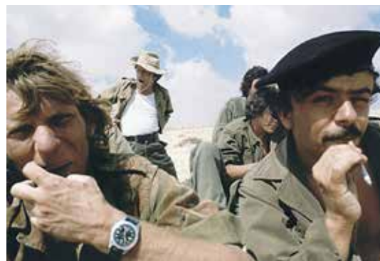
Avoir 20 ans dans les Aurès

Les Équilibristes de Nico PAPATAKIS (tourné en partie au Cirque Jules-Verne) Themroc de Claude FARALDO 7 morts sur ordonnance de Jacques ROUFFIO Adieu Bonaparte de Youssef CHAHINE