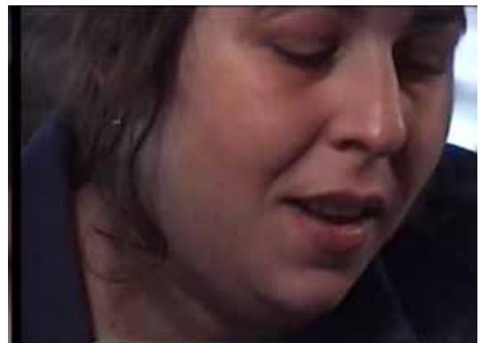
El ano del descubrimiento