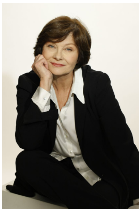
Une femme mariée

Elle part pour New-York, suit des cours à l'Actors'Studio pendant près de 2 ans, joue dans quelques téléfilms, décroche un petit rôle dans une comédie de Daniel MANN (Dean MARTIN en vedette) mais l'ambiance Hollywoodienne et américaine lui déplaît fortement. Elle sent que c'est en France que le cinéma bouge. La Nouvelle vague vient de briser les conventions cinématographiques. Elle rentre en France. Et là, deux belles rencontres vont être déterminantes pour elle. Celle de Michel DEVILLE, alors tout jeune cinéaste, pas encore vraiment reconnu mais dont l'originalité est déjà remarquée. Pour son deuxième film, Adorable menteuse , il lui confie un rôle important, plein de fantaisie, celui de la sœur de Marina VLADY. Le film est comme un bonbon acidulé, pétillant et plein de douce mélancolie à la fois. Un excellent souvenir pour Macha MÉRIL.