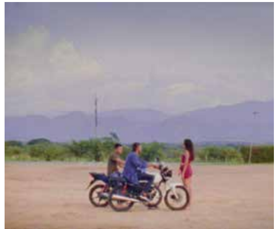
Heliconia