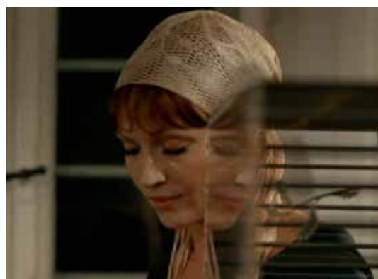
Roulette chinoise