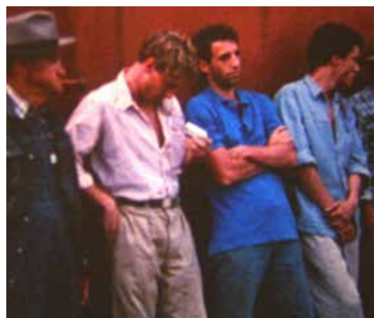
Baton rouge